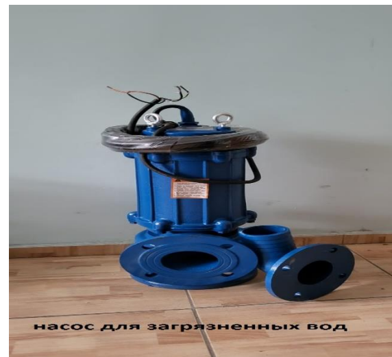
2.2. Ластанған суларға арналған Гном сорғысы