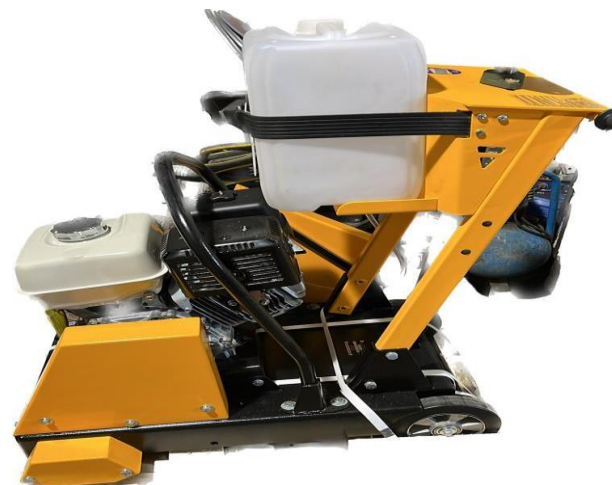
2.5. Жік кескіш