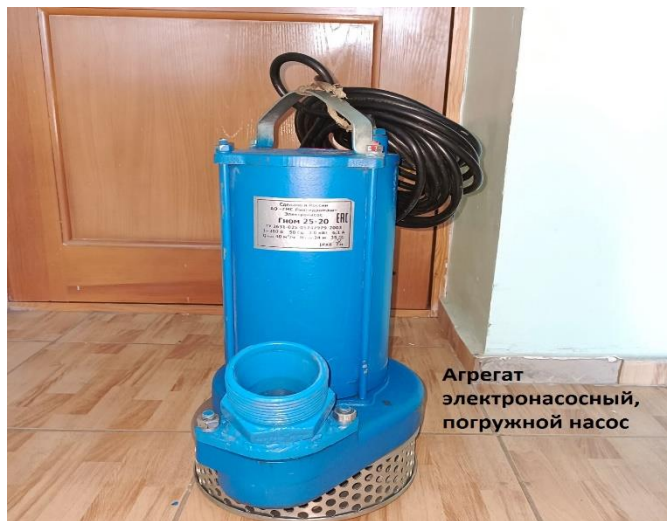
2.1. Ағынды суларға арналған батырылатын сорғы