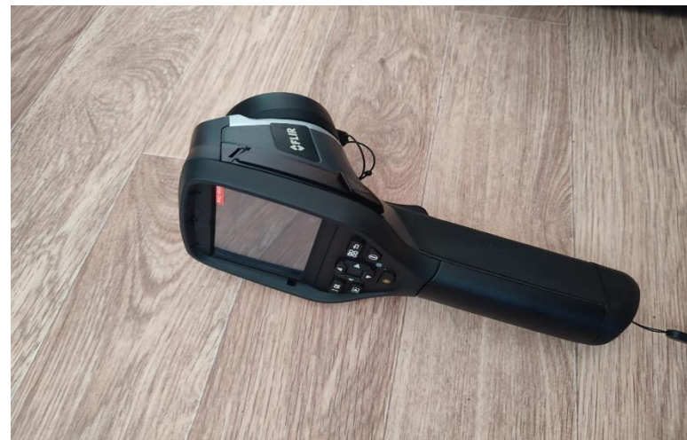
4.1. Жылу сезгіш