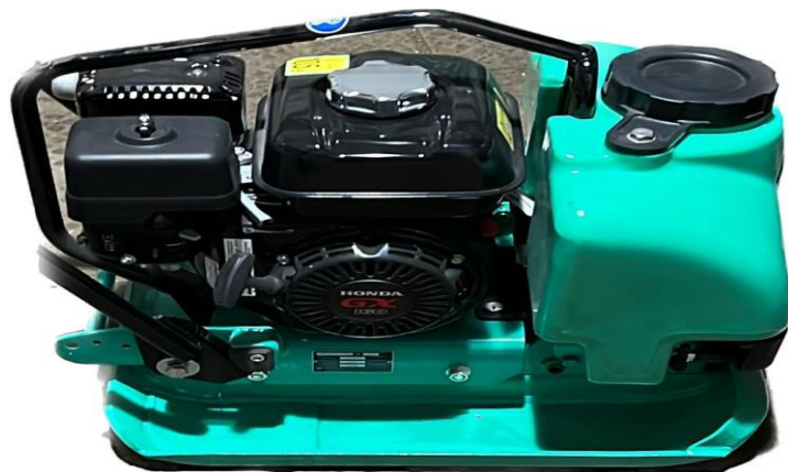
2.4. Діріл тақтайы